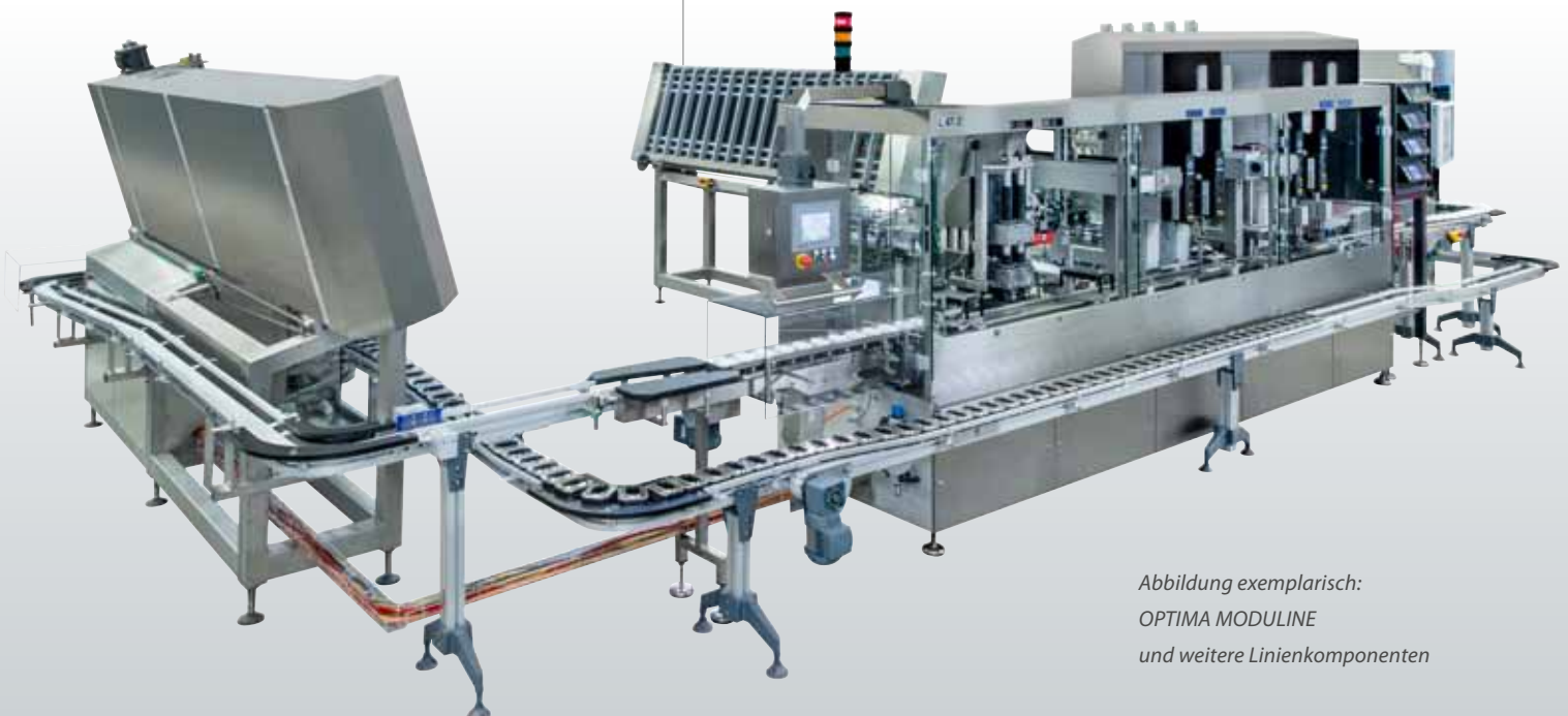
Abbildung exemplarisch: OPTIMA MODULINE und weitere Linienkomponenten