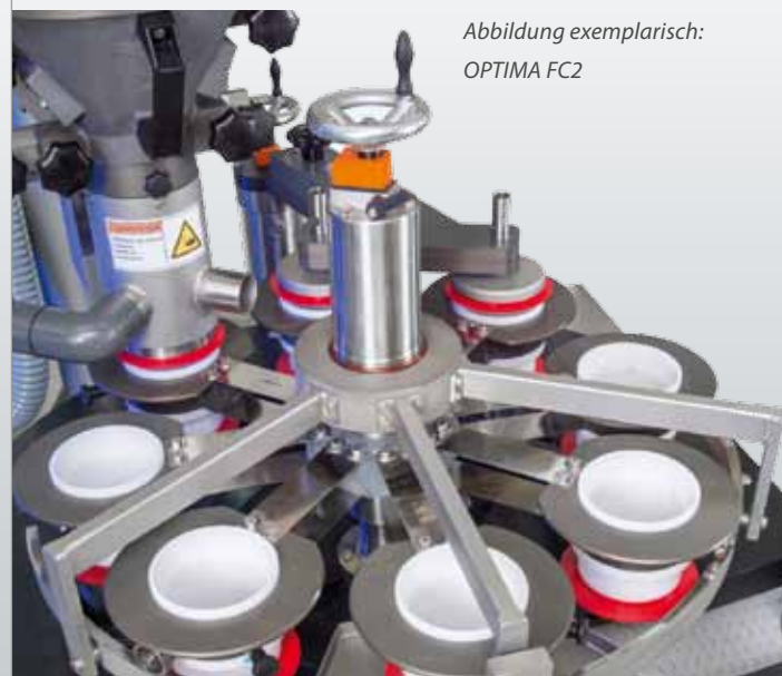
Abbildung exemplarisch: OPTIMA FC2