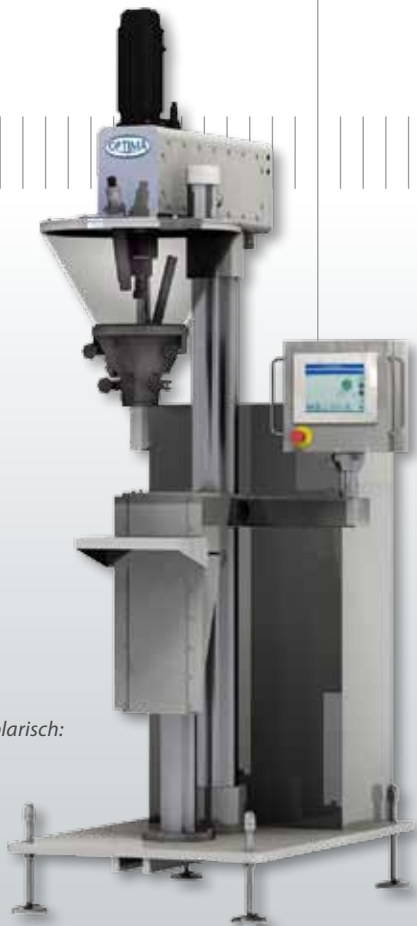
Abbildung exemplarisch: OPTIMA SD2